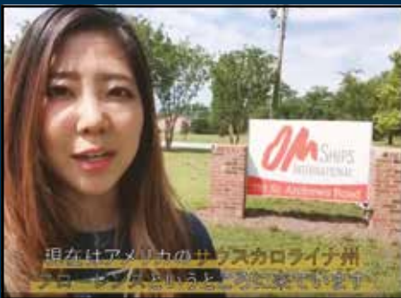
現在はアメリカのカラカスコロライナ州

ロゴス・ホープ号は今年初め、当時航海していたヨーロッパを離れ、カリブ海のジャマイカに停泊。そして3月中旬に、今年7月までの（3ヶ月間の）活動停止とカリブ海における滞在を決定しました。船内感染を防ぐため、地元の教会への協力、船内と船外における伝道活動や人の往来も感染経路を断つため全て失くしました。船員のスピリットは非常に良く、日常船内業務の時間の他は「訓練」にそのフォーカスをおき、聖書の学び、宣教学の学び、また小グループによるデボーションなどをおこなっています。引き続きOM船とクルーのためにお祈りください。