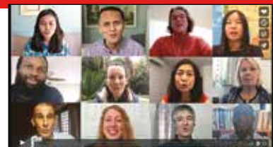
新型コロナウイルス（COVID19）による緊急事態のなか、OM宣教師たちの働きを観てみよう（英語ビデオ）

OMのミッションステートメント： 私たちの願いは、最も福音が伝えられていない人々の間で、イエスに従う者による生き生きとしたコミュニティが形づくられることです