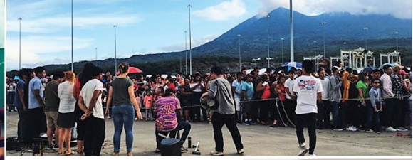
左：アフタースクールでの賛美リード 上：ロゴスの入場の為に港で並ぶ人へのゴスペルライブ 右：ジャマイカの教会でのメッセージ